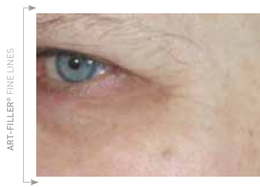
Po 18 miesiącach