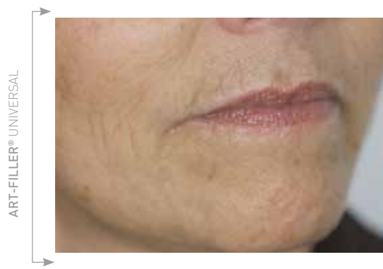
Po 18 miesiącach